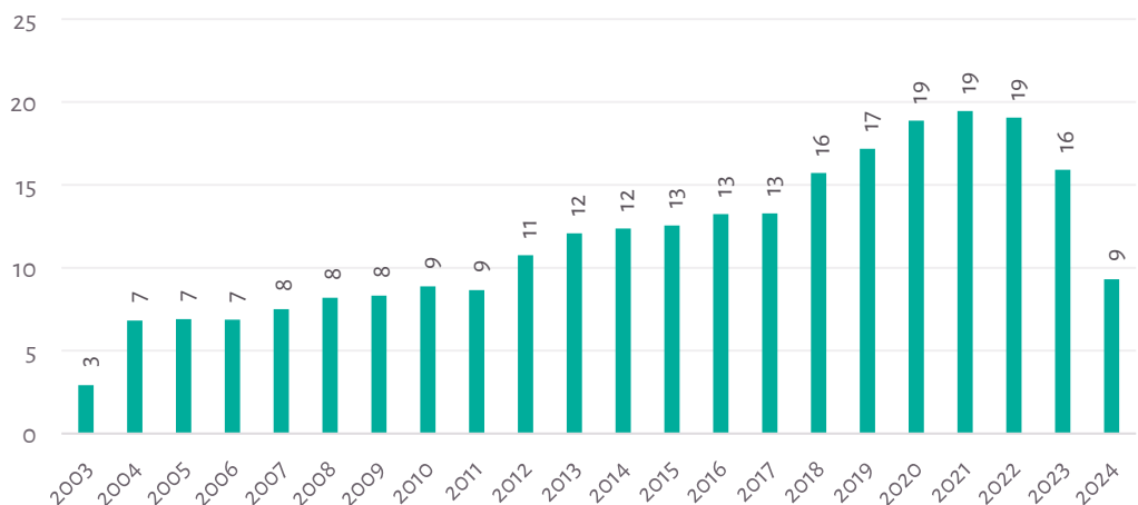
Evolución de fondos pagados en Cuotas Mortuorias Millones de dólares al 31-07-2024

Fuente: elaboración Gerencia de Estudios AAFP, con base en datos de la Superintendencia de Pensiones.